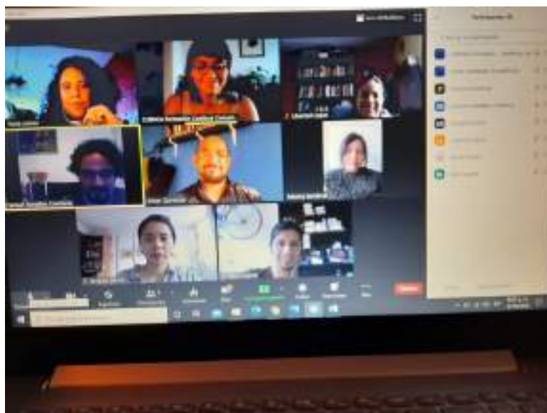
Fotografía: Reunión del 3 de septiembre entre el equipo de CUENCA y el de la Acción Social Festivales e Intervenciones Comunitarias para definir el taller PALIMPSESTO