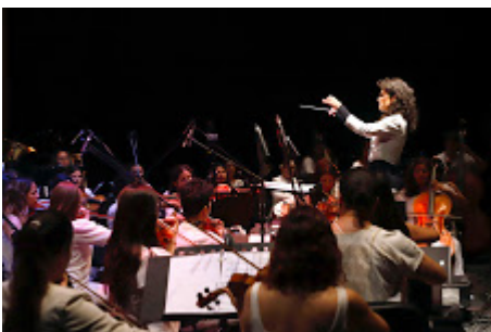
MX MM ORQUESTA SINFÓNICA SORORIDAD_70.jpg 843K