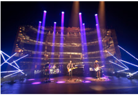
MX MM FOBIA_16.jpg 725K