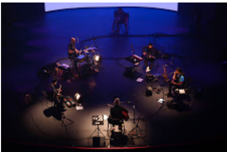
MX MM LA GUSANA CIEGA_24.jpg 584K