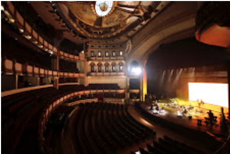
MX MM LA GUSANA CIEGA_03.jpg 826K