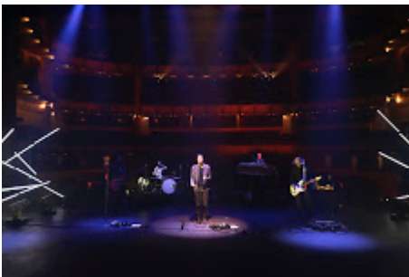
MX MM FOBIA_21.jpg 497K