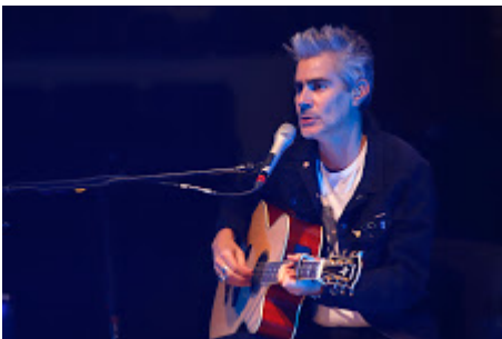
MX MM LA GUSANA CIEGA_32.jpg 401K