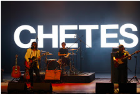
MX MM CHETES_01.jpg 570K