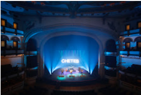
MX MM CHETES_14.jpg 599K