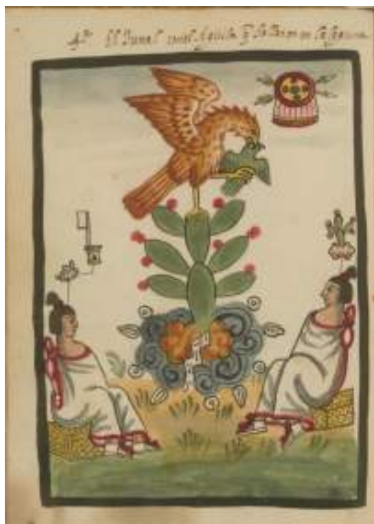
Fundación de Tenochtitlan en el tunal tenochtli . El escudo con flechas cruzadas representa a Copil, hijo de Malinalxóchitl. Códice Tovar .

A principios del siglo XV, y tras el crecimiento paulatino de este núcleo urbano, los mexicas solicitaron a los tepanecas permiso para la creación de una estructura de barro y madera que transportara agua dulce y potable desde Chapultepec hasta su población. El vínculo que el tlatoque Chimalpopoca (1417-1426) poseía con la aristocracia tepaneca por el lado materno, le valió la simpatía de su abuelo Tezozómoc, señor de Azcapotzalco, por lo que la solicitud fue aceptada. En Historia de las Indias de Nueva España e islas de tierra firme , fray Diego Durán nos cuenta de la petición de los tenochcas: