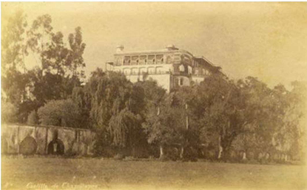
Fotografía del Castillo de Chapultepec y Acueducto, 1880.