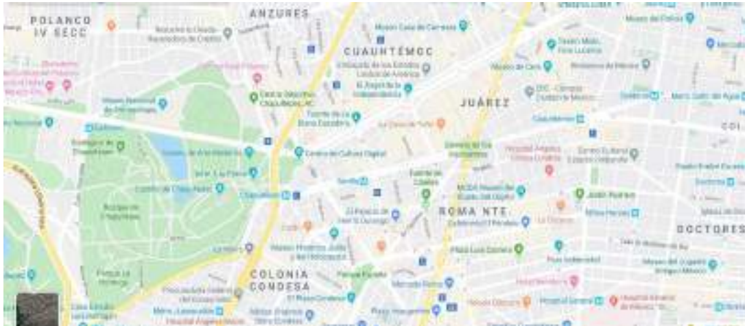
1. Mapa actual del Bosque 1ra sección y Avenida Chapultepec. Tomado de Google maps, https://www.google.com.mx/maps/@19.423812,-99.1690566,15z