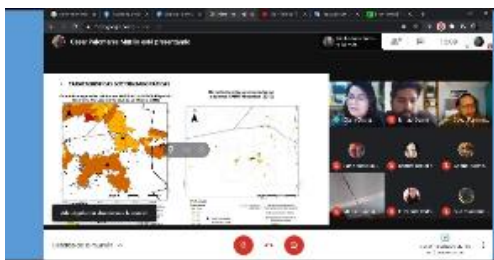
Contexto: Reunión con Faro Miacatlán y el equipo de vinculación pedagógica. Casa 6 de noviembre