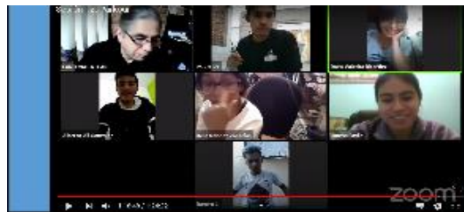
Contexto: Sesión 12 del taller Parkour de los TLL Casa 20 de noviembre