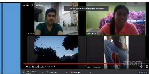
Contexto: Sesión 9 del taller de parkour de los TLL Casa 11 de noviembre