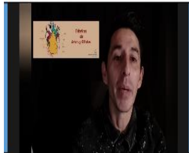
Contexto: Podcast "Circo, Maromay Clown" (Grabación) Fecha: 18 nov 2020