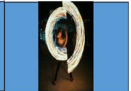
Contexto: Grabación, preparación de set iluminación y pruebas de audio. Fecha: 09 dic 2020