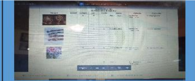
Contexto: Diseño de la clasificación del catálogo 3 de diciembre