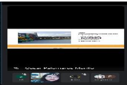
Contexto: reunión y Taller tema: referentes pedagógicos Cuantitativo y cualitativo