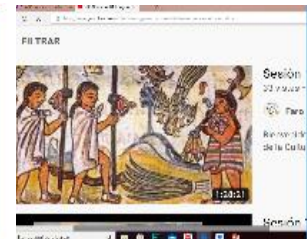
Contexto: Aquí podemos ver el video de la sesión 15 del 1 de diciembre.