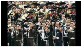
CANCIÓN POPULAR "CIELITO LINDO"

"Taller de Guitarras y Cantos Populares" Faro Macatán Por: Abad Morán José Rigoberto