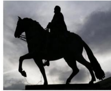
CANCIÓN POPULAR "EL JINETE"

"Taller de Guitarras y Cantos Populares" Faro Macatán Por: Abad Morán José Rigoberto