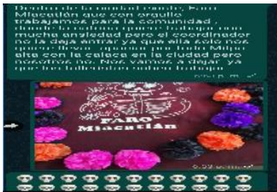
Contexto: realiza de calaverita literaria fecha: 02/11/2020 lugar: realización, en casa