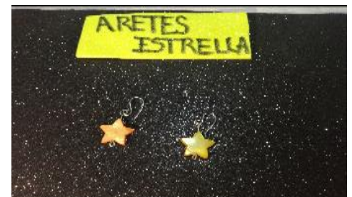
Contexto: realización de aretes de estrella fecha: 09/12/2020 lugar: se realizó tutorial en casa