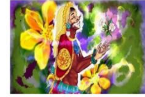
CANCIÓN POPULAR "XOCHIPITZAHUATL (FLOR MENUDITA)"

"Taller de Guitarras y Cantos Populares" Faro Macatán Por: Abad Morán José Rigoberto