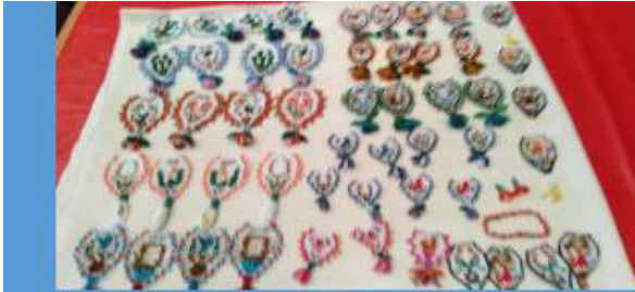
Contexto: Puntas de chaquiras, Doña Piedad López Aguilar . 2 de diciembre