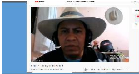
Contexto: La foto muestra la sesión en línea del taller de lengua y cultura náhuatl. 3 de noviembre.