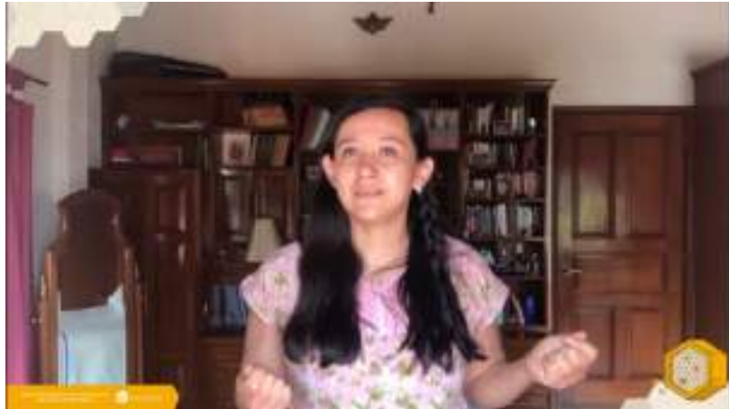
Cápsula 2. Hábitat Sonoro