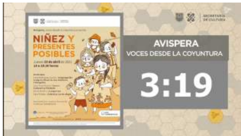
Cortinilla del video de Avispera, emisión número 11

La cortinilla fue diseñada para las distintas emisiones de Avispera, sin embargo, se irán personalizando para que se pueda encontrar el cartel y los minutos que marca el inicio del video. La cortinilla se encuentra ubicada desde el minuto 0:36 del video antes mencionado y en la parte final del video en el minuto 1:37:05