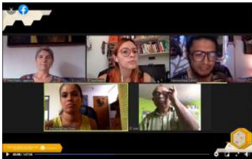
Video de la transmisión de Avispera número 11