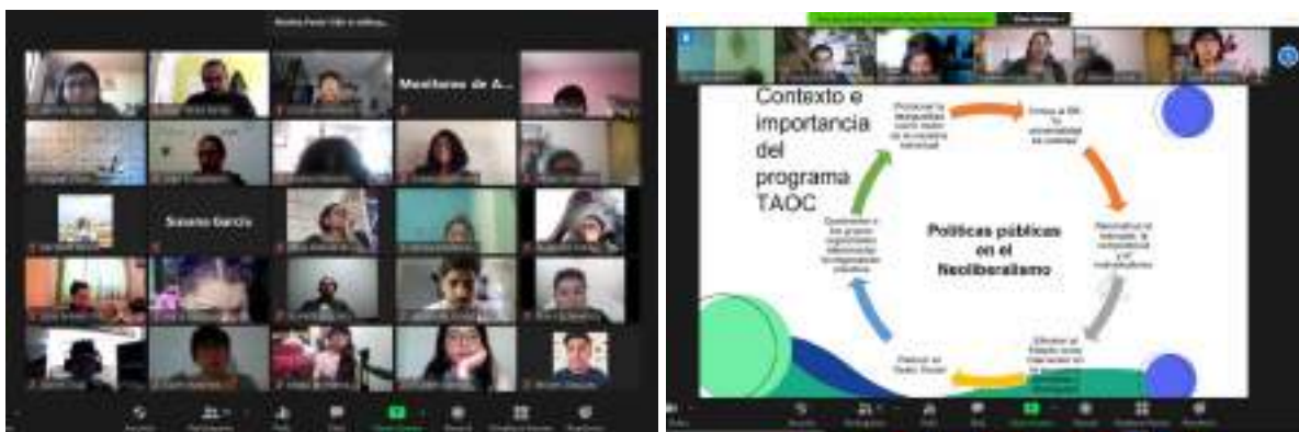
* Coordinaciones comunitarias

Registro fotográfico de algunas sesiones de los talleres: