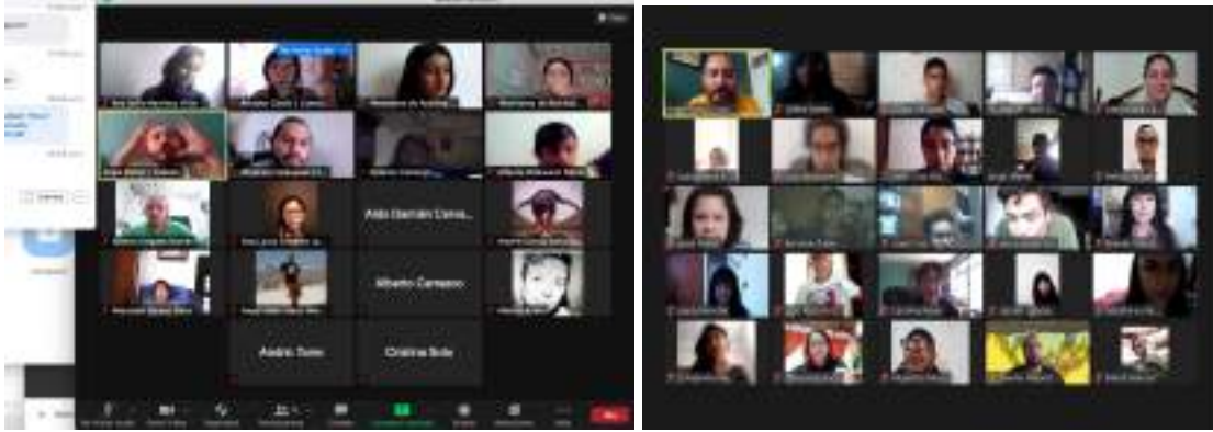
* Tejido común