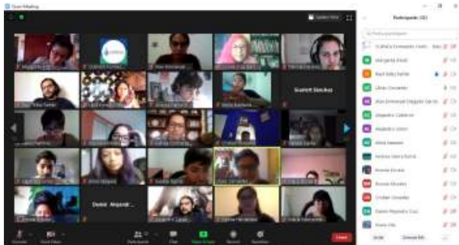
* Taller temático

Registro fotográfico de algunas sesiones de los talleres: