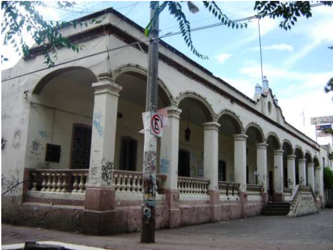
Vista general, 2009.

El inmueble, ubicado en el centro del pueblo, frente a un jardín, cuenta con una escalera de doble rampa simétrica con balaustrada. La fachada presenta un portal que funciona como vestíbulo del edificio y está compuesto por nueve arcos de medio punto apoyados sobre columnas de base cuadrangular. El portal está protegido por una balaustrada interrumpida por dichas columnas. Una cornisa moldurada da pie al remate del edificio, mixtilíneo en la parte central, el cual presenta un escudo con el águila republicana, tres pináculos y un asta bandera.