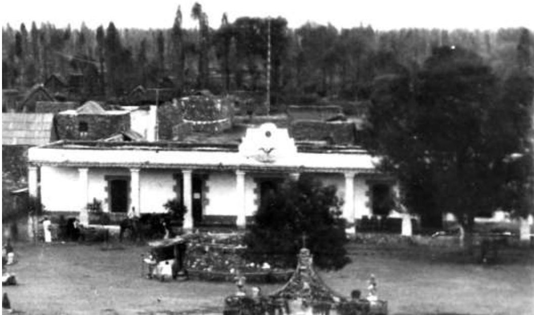
Antiguo edificio de gobierno, 1898. CNMH-INAH-CONACULTA-MEX.