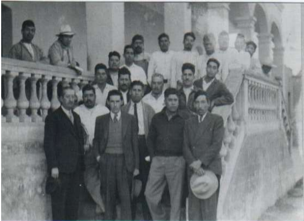
Junta de subdelegados de Tláhuac en el antiguo edificio de gobierno, 1942.