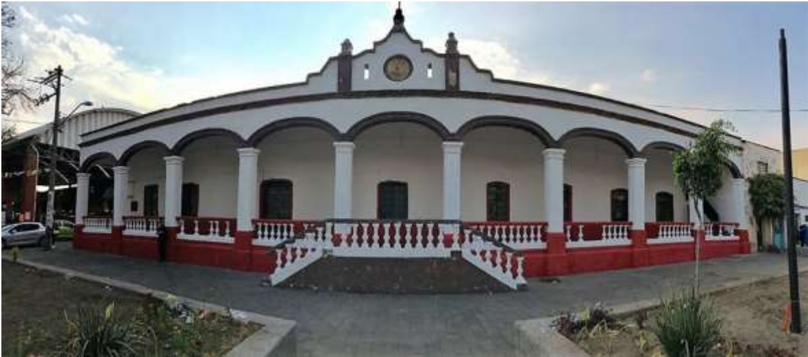
Fachada del Antiguo Palacio de Gobierno después de la rehabilitación, 2018