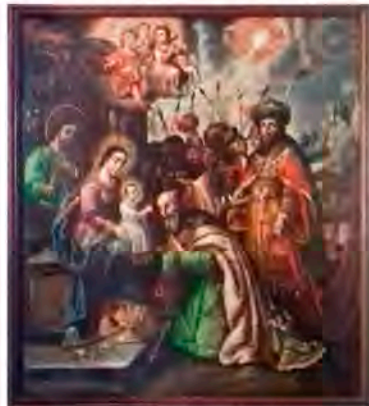
Óleo de la visita de los Reyes Magos al Niño Jesús. Lety Zarazúa, 2018

El pueblo de Los Reyes tiene la peculiaridad de contar con dos grandes fiestas patronales, una es la fiesta del Señor de las Misericordias, que involucra a varios pueblos y barrios de Coyoacán y otras alcaldías; la otra, es la gran celebración de los Reyes Magos.