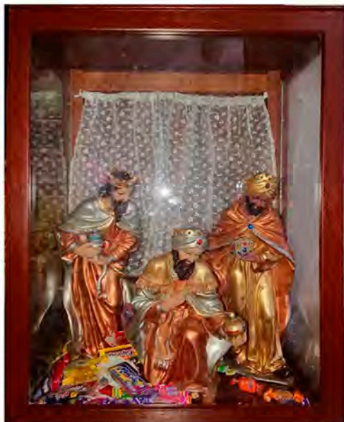
La 'mandita' de los Reyes Magos. Santiago, 2020.

Los días posteriores, cada mayordomo ofrece una fiesta en honor a cada uno de los Reyes. Un día entero se le destina a Melchor, otro a Gaspar y un último a Baltasar, iniciando con una misa a las ocho de la mañana con una comitiva integrada principalmente por niños vestidos con atuendos de Reyes Magos. Las niñas son vestidas de blanco y desempeñan el papel de cereras , o portadoras de las velas. Los niños arriban a casa del mayordomo en turno y en este hogar se reparte atole de pinole acompañado de tamales. Durante el transcurso de la mañana se realizan los preparativos para ofrecer una comida. Alrededor de las seis de la tarde, la comitiva regresa a la iglesia a rezar el Santo Rosario.