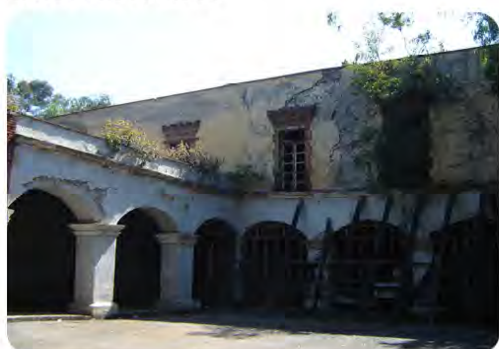
Detalle del interior de la casa de la ex hacienda, 2009.