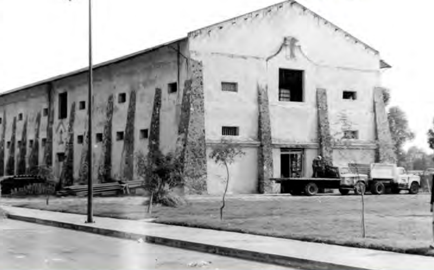
Fachada de la troje, s/f.