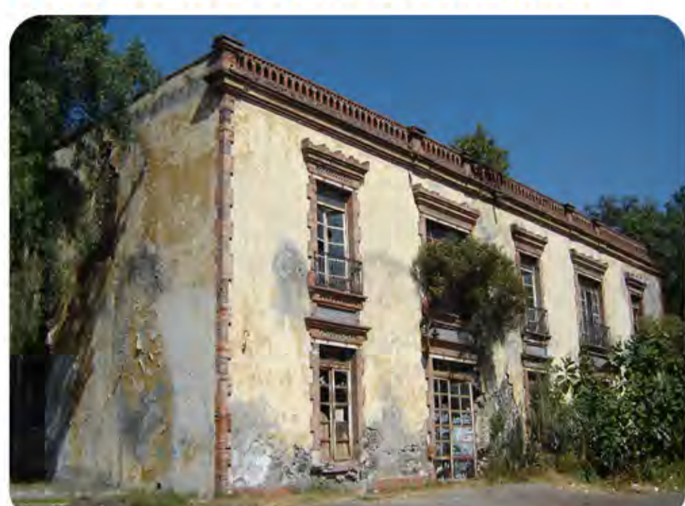
Detalle de la fachada de la casa de la ex hacienda, 2009.