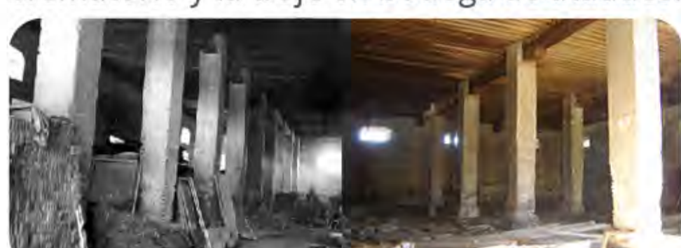
Detalle de interior, s/f.

En 1970 se expropiaron a favor del Gobierno del Distrito Federal las hectáreas que quedaron sin repartir; éstas fueron convertidas en panteón; el casco de la hacienda en crematorio y la troje en bodega de ataúdes.