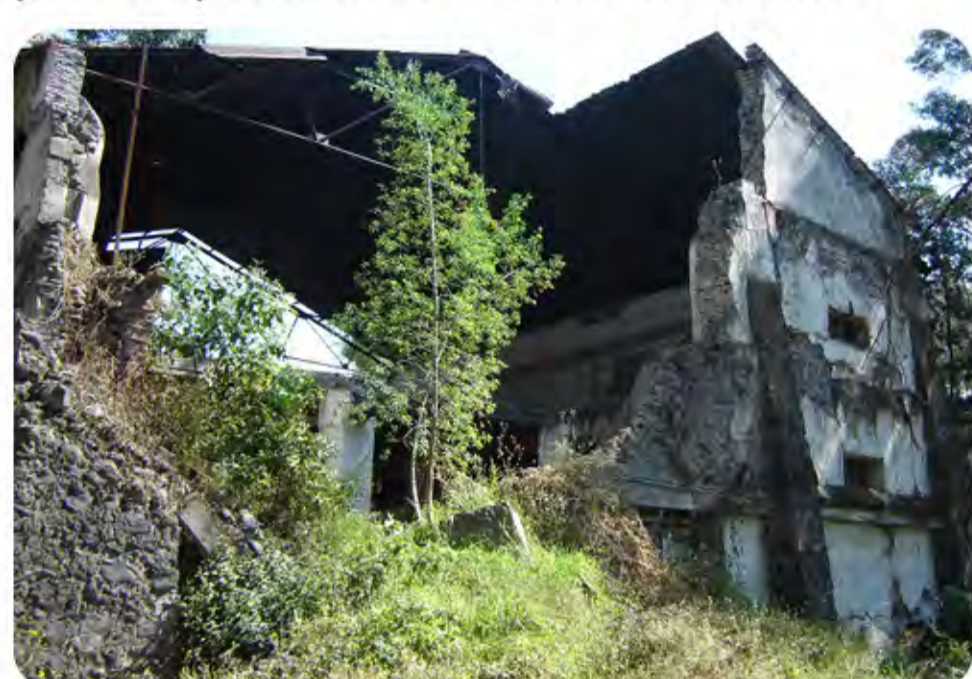
Detalle de la fachada de la troje, 2009.

La ex Hacienda de San Nicolás Tolentino se encuentra dentro del predio que comprende el Panteón de San Lorenzo Tezonco, los inmuebles que la integran son la troje y la casa de la hacienda. La troje es un ejemplo de la arquitectura agrícola del siglo XIX. Contiene una planta rectangular de tres naves separadas por gruesos pilares que, a su vez, marcan 12 tramos, más uno por cada lado, que corresponden a los accesos laterales, mientras que la fachada principal presenta una discreta portada cuya altura aproximada es de 10 a 12 metros. Al interior cuenta con un entepiso de vigería y con una cubierta de armaduras metálicas a dos aguas, soportadas perimetralmente por los muros laterales logrando un claro más o menos de 10 metros. Los materiales en los muros son combinados a base de hiladas de adobe y ladrillo, con morteros de arcilla y cal, realizados en forma de paneles y retículas en forma de cadenas y verdugones. El paramento es en escarpio aumentado por lógica hacia las bases de los mismos muros y, como refuerzos adicionales, se tienen contrafuertes de mampostería, al parecer agregados a los apoyos continuos, pero respetando el ritmo de los tramos.