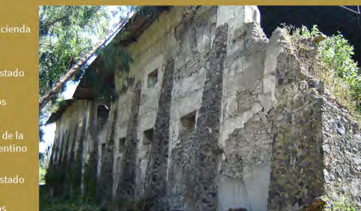
Detalle de la fachada lateral de la troje, 2009.