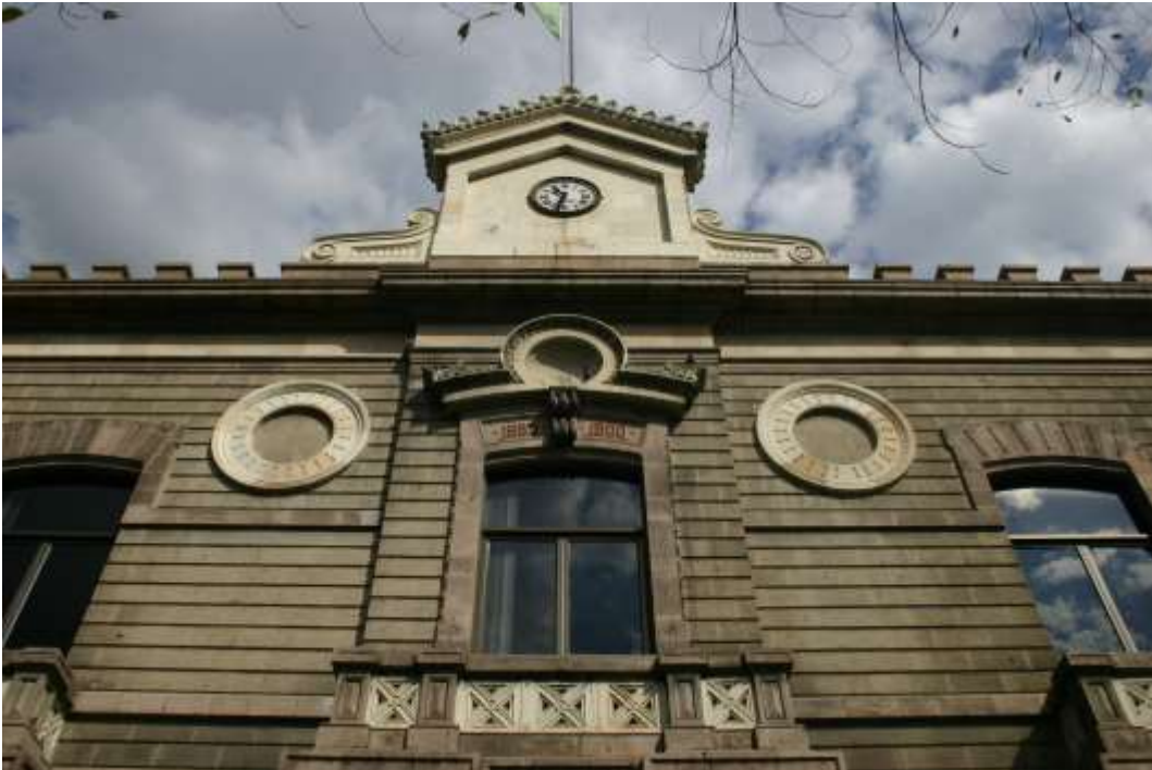
Detalle de portada, 2009.