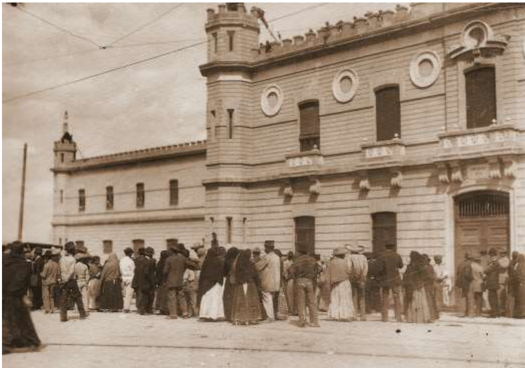
Escena durante la Decena trágica, febrero de 1913.