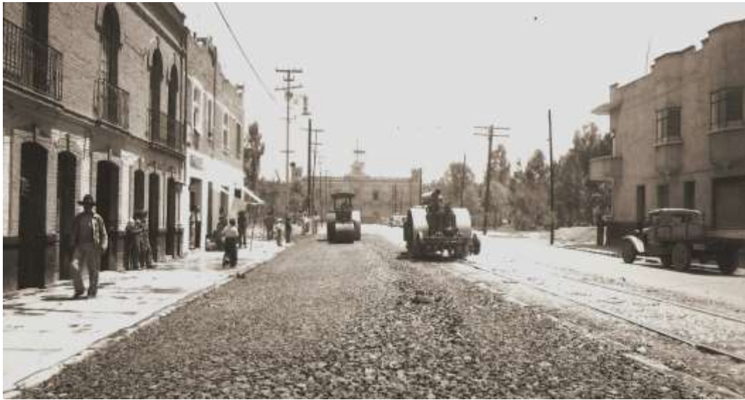
Al fondo, fachada de la penitenciaría, 1928.

Las obras de cimentación comenzaron el 9 de mayo de 1885, proceso que duró un año debido a las características del subsuelo y al gran peso de la edificación. Para resolver el problema se solicitó la intervención de la compañía estadounidense Pauly Building Manufactoryn Company contratada por la cantidad de $530 000 pesos, la cual se comprometió a terminar el segundo nivel el 15 de septiembre de 1895, con un total de 886 celdas y dos tanques que abastecían de agua al inmueble, en el que se invirtió la cantidad de $2 396 914. 84 pesos. Sin embargo, tras dicha inversión fueron necesarios $22 000 pesos más para la construcción de la torre central por la misma empresa. 6