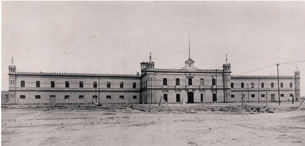
Fachada principal, s/f.