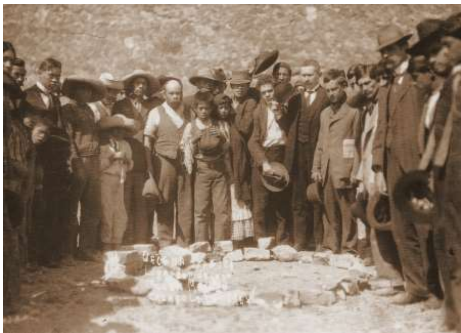
Lugar donde cayó muerto Madero en los alrededores de Lecumberri, 1913.