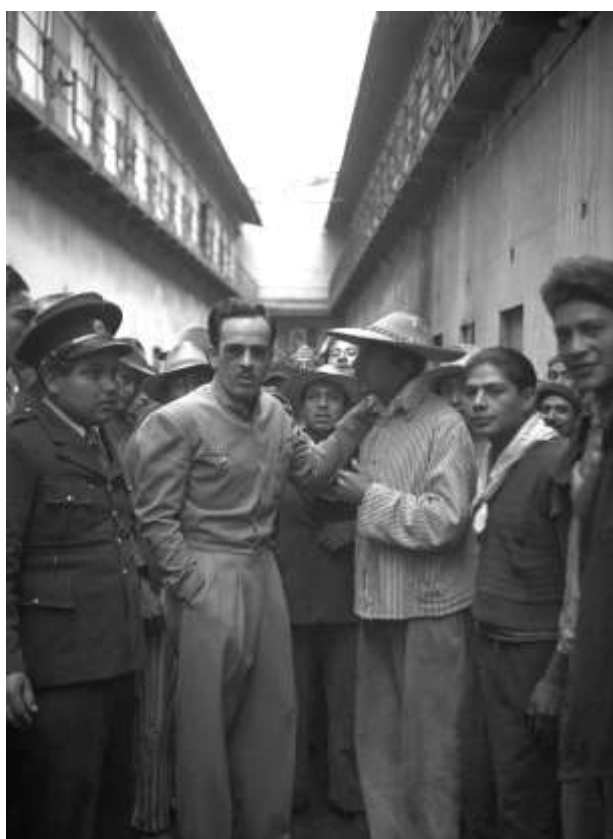
Pedro Infante en la Penitenciaría de Lecumberri durante la filmación de Nosotros los pobres , 1950.