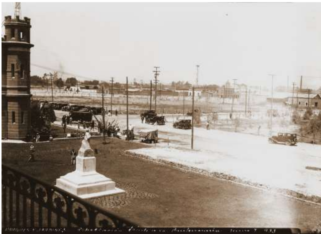
Vista de los alrededores de Lecumberri, 1933.

Es un extraño espectáculo; siempre hay puertas abiertas pero nunca antes de ahora había estado en medio del patio mirando todas las celdas abiertas a la vez, y todas sumidas en la oscuridad; son agujeros, pasadizos secretos que llevan a otras cárceles. En el piso superior también están abiertas todas las celdas; dos pisos de puertas que a veces el viento empuja y de celdas oscuras que rodean completamente un patio cubierto de basura, papeles, vidrios rotos, cáscaras de limón, azúcar, libros sin pastas, cintas de máquina desenrolladas en el suelo, manchas de sangre. 8