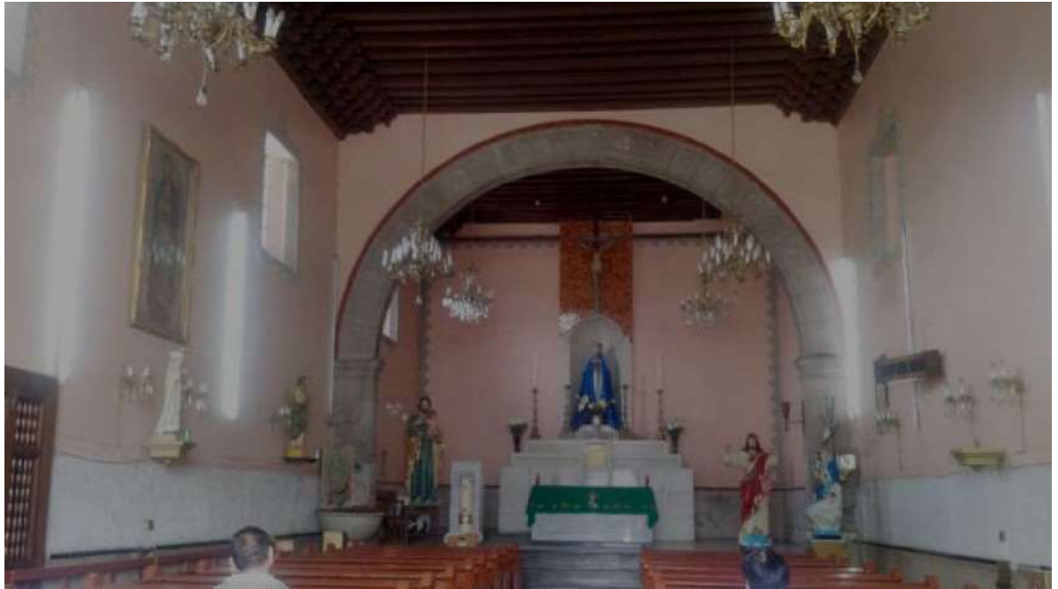
Detalle del interior de la parroquia.