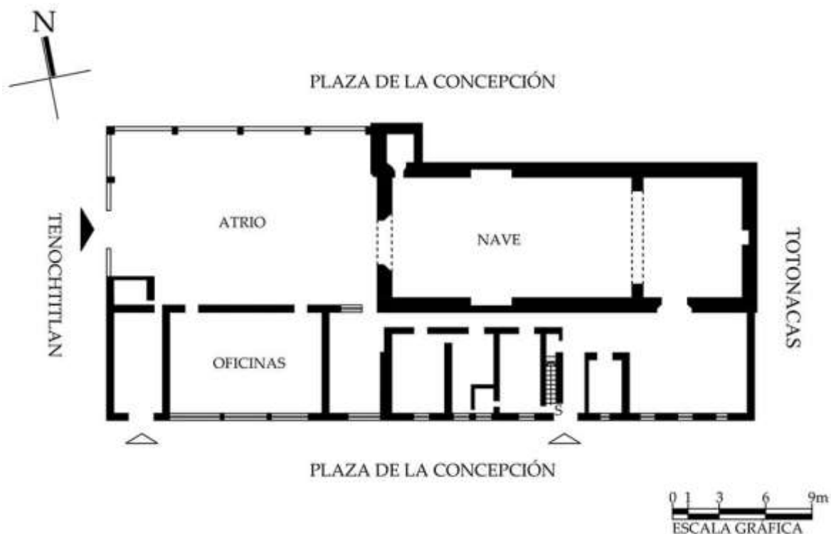
Planta arquitectónica. CNMH-INAH-CONACULTA-MEX.