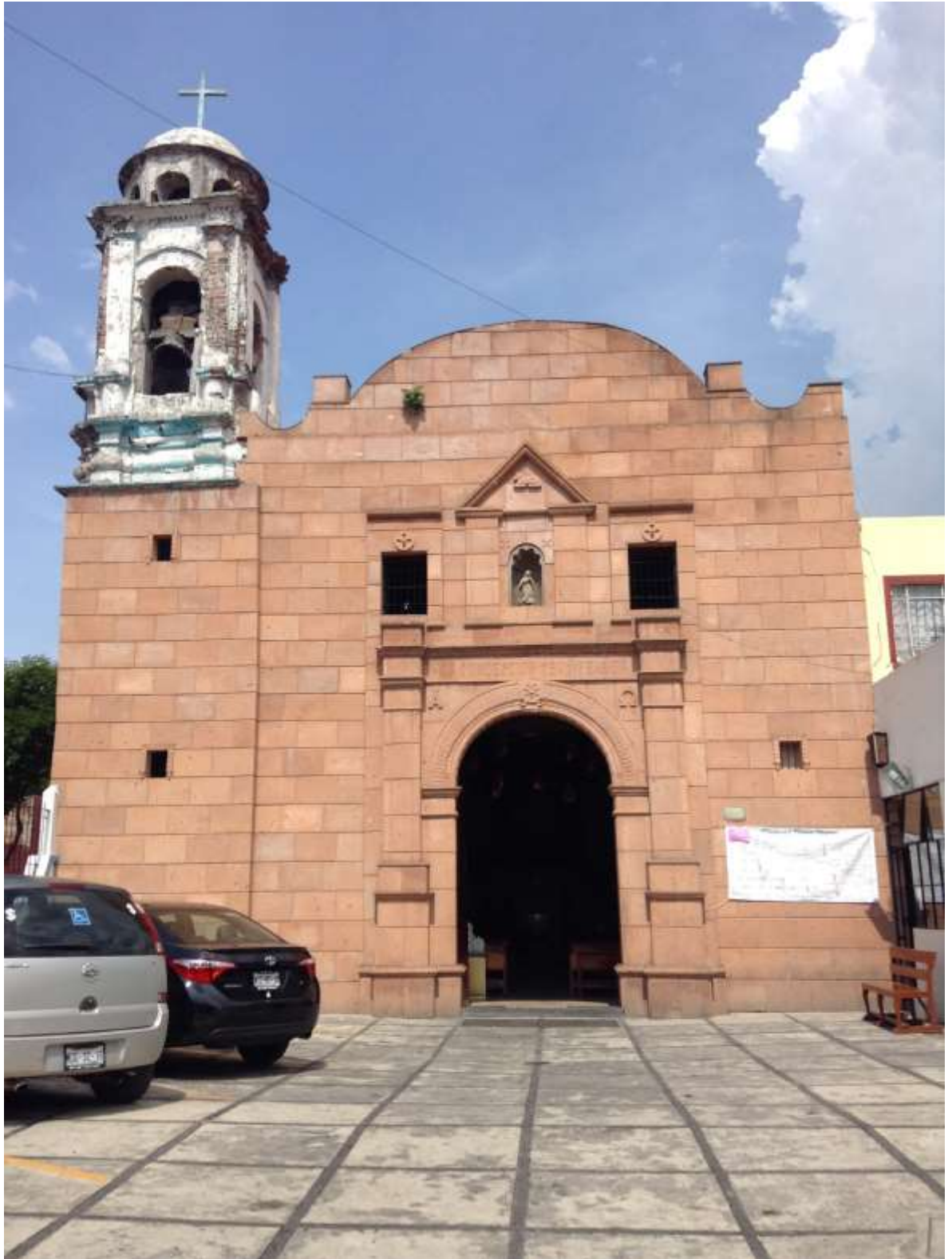
Fachada de la Parroquia de la Concepción Tequipeuhcan