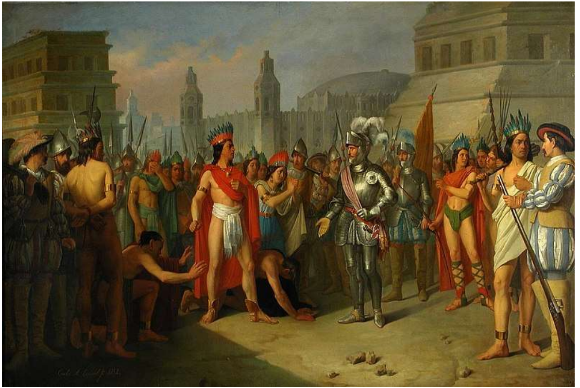
Tlatoani Cuauhtémoc y Hernán Cortés