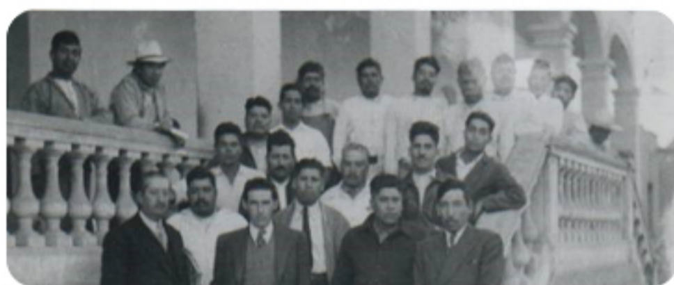
Junta de subdelegados de Tláhuac en el antiguo edificio de gobierno, 1942.

El Decreto presidencial publicado el 31 de diciembre de 1928 dispuso la desaparición de los municipios y la creación de 13 delegaciones políticas; Tláhuac fue una de ellas y estaba constituida por siete pueblos originarios.