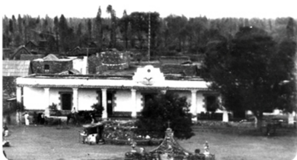
Antiguo edificio de gobierno, 1898.