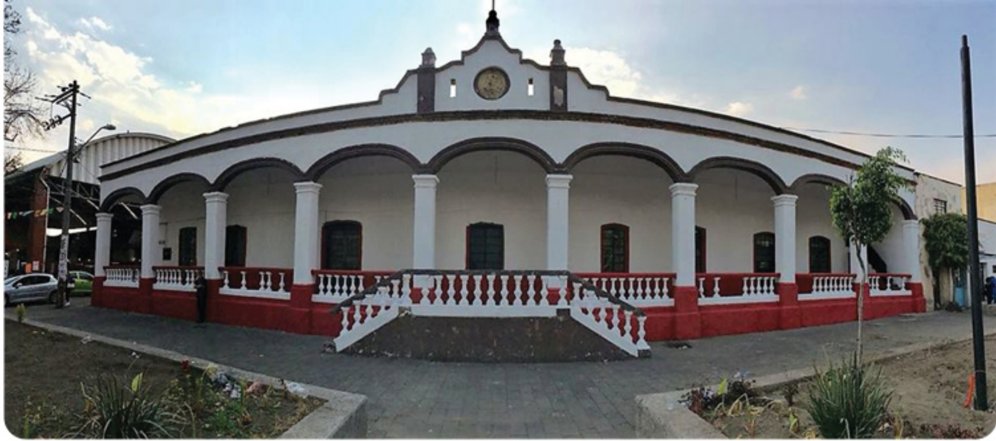
Fachada del Antiguo Palacio de Gobierno después de la rehabilitación, 2018