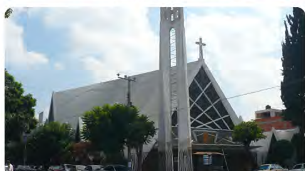
Detalle de fachada, 2009.

Louise Noelle describe su estructura de la siguiente manera: