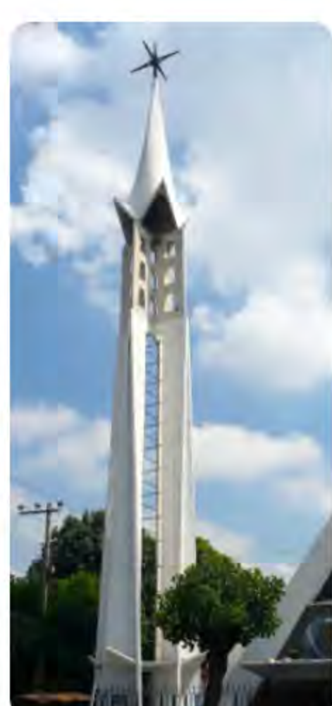
Detalle torre, 2009.

De esta forma, a finales de 1949 la administración provincial hizo varias diligencias ante la mitra metropolitana. Más tarde el arzobispo, Luis María Martínez, extendió un documento aprobando la fundación de casa e iglesia en dicha colonia. Los planos comenzaron a trazarse en febrero de 1952 y en noviembre del mismo año fueron destinados a la obra el sacerdote Murillo y Pedro Martínez. En enero del año siguiente se inició la construcción del salón y sobre éste, la casa. Concluida la obra, se bendijo dicho salón, al que llamaron “Capilla de la Milagrosa”.