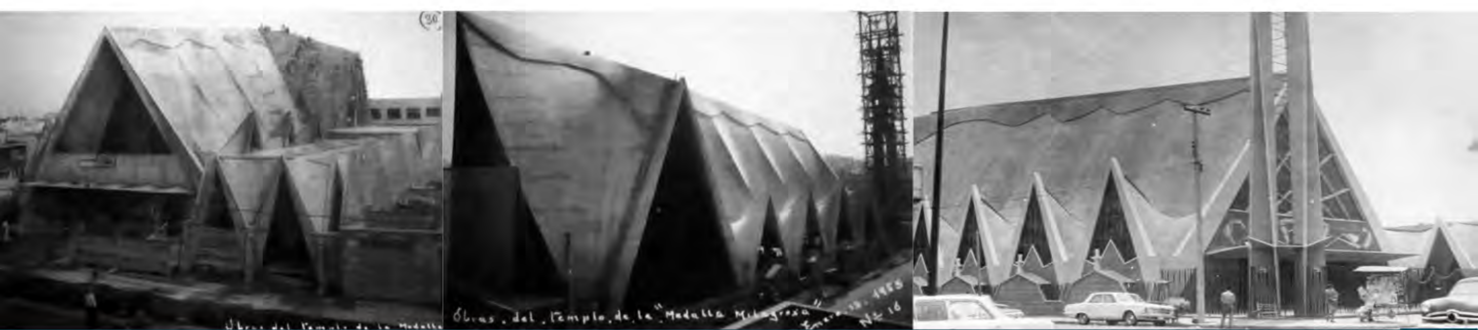
Detalle de fachada, s/f.

El mural de la capilla de Nuestra Señora de Guadalupe, en esmalte sobre cobre, fue realizado por los hermanos Ritter de México.