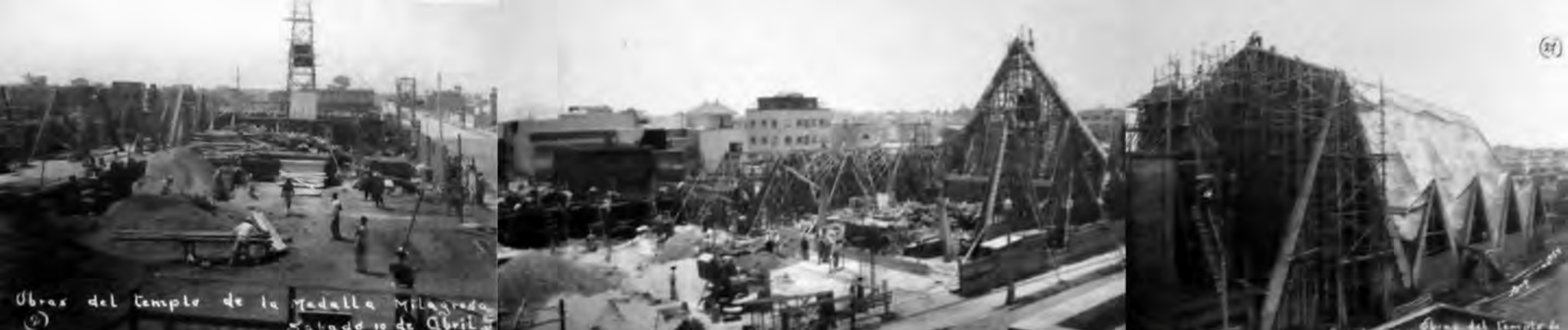
Detalle de construcción, 1954.