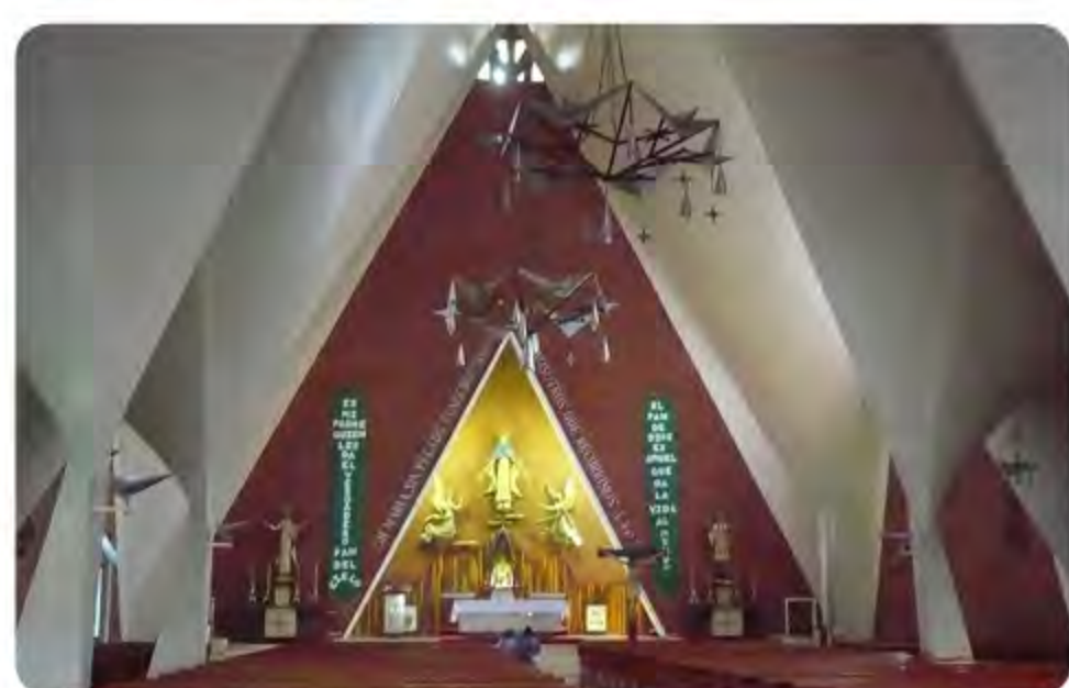
Detalle interior, 2009.

En el interior se puede observar, detrás del altar, un muro de ladrillo que termina en el ángulo más alto del edificio. Sobre él se encuentra un retablo con la imagen de la Virgen Milagrosa con un ángel a cada lado; algunas esculturas de madera sobresalen del muro.