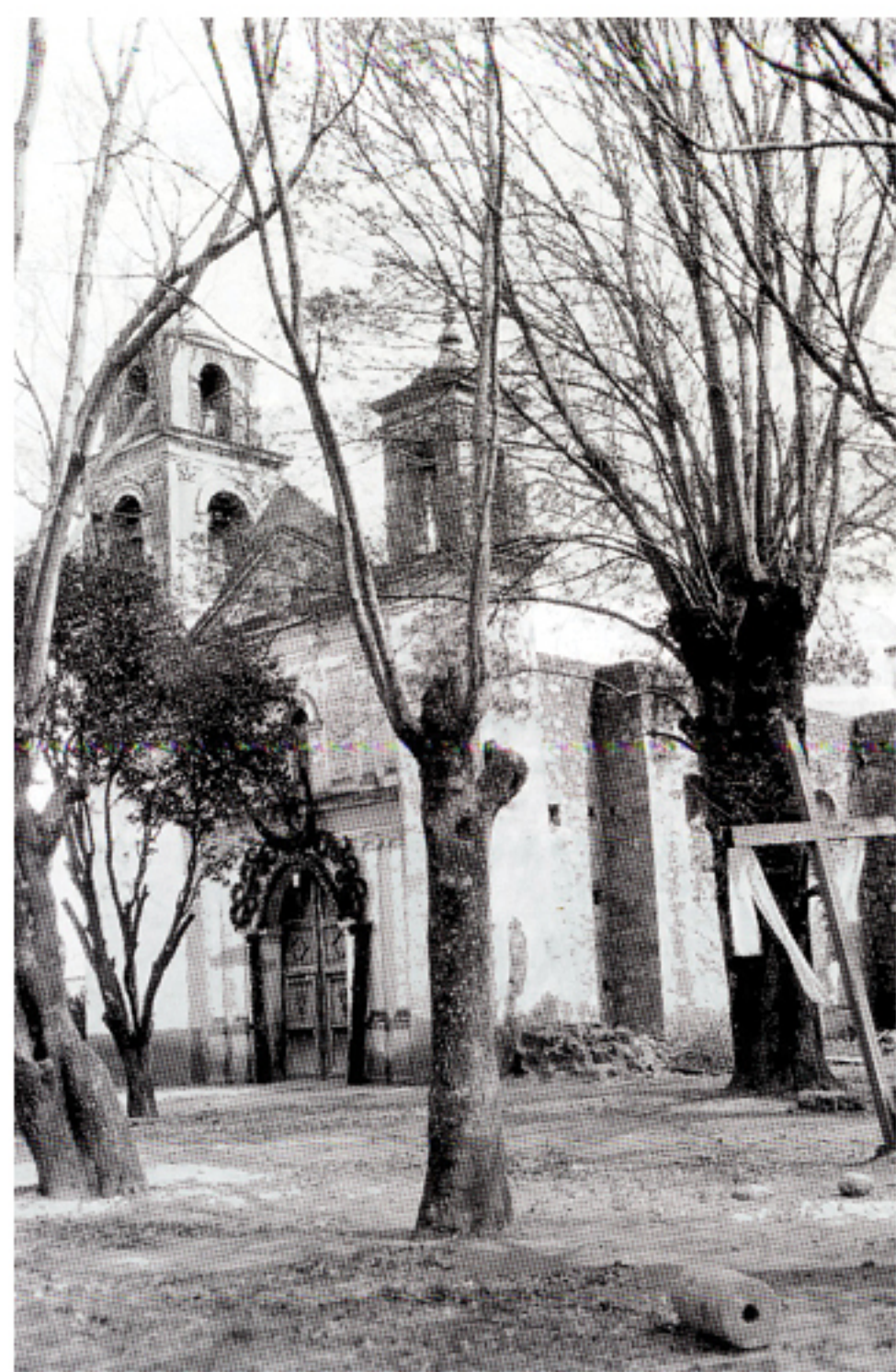
Templo de San Mateo, s/f.

La torre del costado derecho es más angosta y sólo posee dos cuerpos: el primero es similar al de la izquierda, mientras que el segundo está compuesto por un vano con arco de medio punto ornamentado con flores talladas en piedra. Lo protege un barandal de hierro y remata con un entablamento cuyo friso está decorado con motivos fitomorfos. Culmina con un pináculo y una cruz de piedra en la cima.