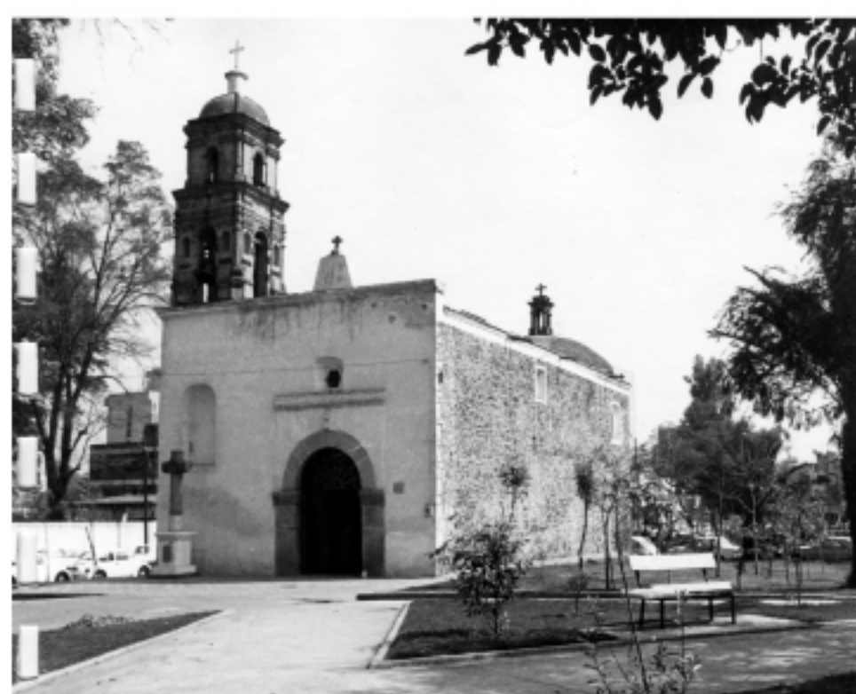
Fachada, s/f. CNMH-CONACULTA-INAH-MEX.

En 1961 se autorizaron otra serie de remodelaciones para retirar los elementos arquitectónicos modernos. La Dirección de Monumentos Históricos declaró en 1984 que el inmueble procede del siglo xvi, conserva su traza y estructura original, así como la torre del siglo xviii la cruz [la que pertenecía a una de las tumbas demolida en 1950] y la sacristía y que se encontraba en buen estado de conservación.