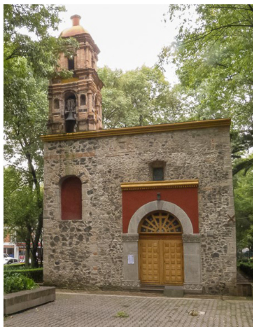
Fachada de la Capilla de San Lorenzo Mártir, 2014.

En su interior el presbiterio está adornado con un arco de piedra de medio punto con adornos de jarrones con flores tallados. El techo está formado de vigas sobre zapatas.