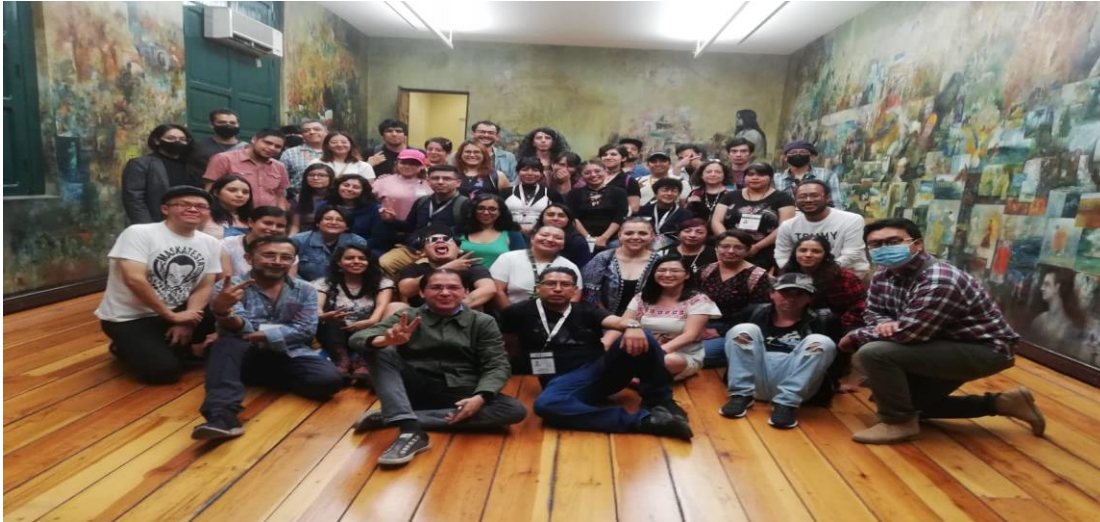
Visita guiada especial por el día internacional de los museos, la Historia del Palacio y Joaquín Clausell a un grupo Comunitario de Pilares Iztapalapa, del Gobierno de la Ciudad de México