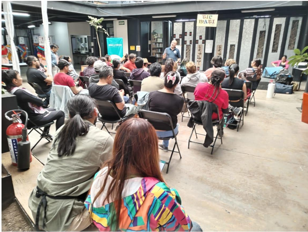
26 DE MARZO. CURSO DE PRIMEROS AUXILIOS.