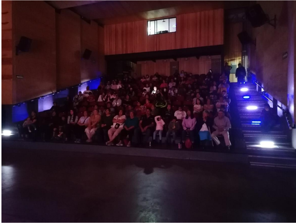
3 DE FEBRERO. EL CASCANUECES