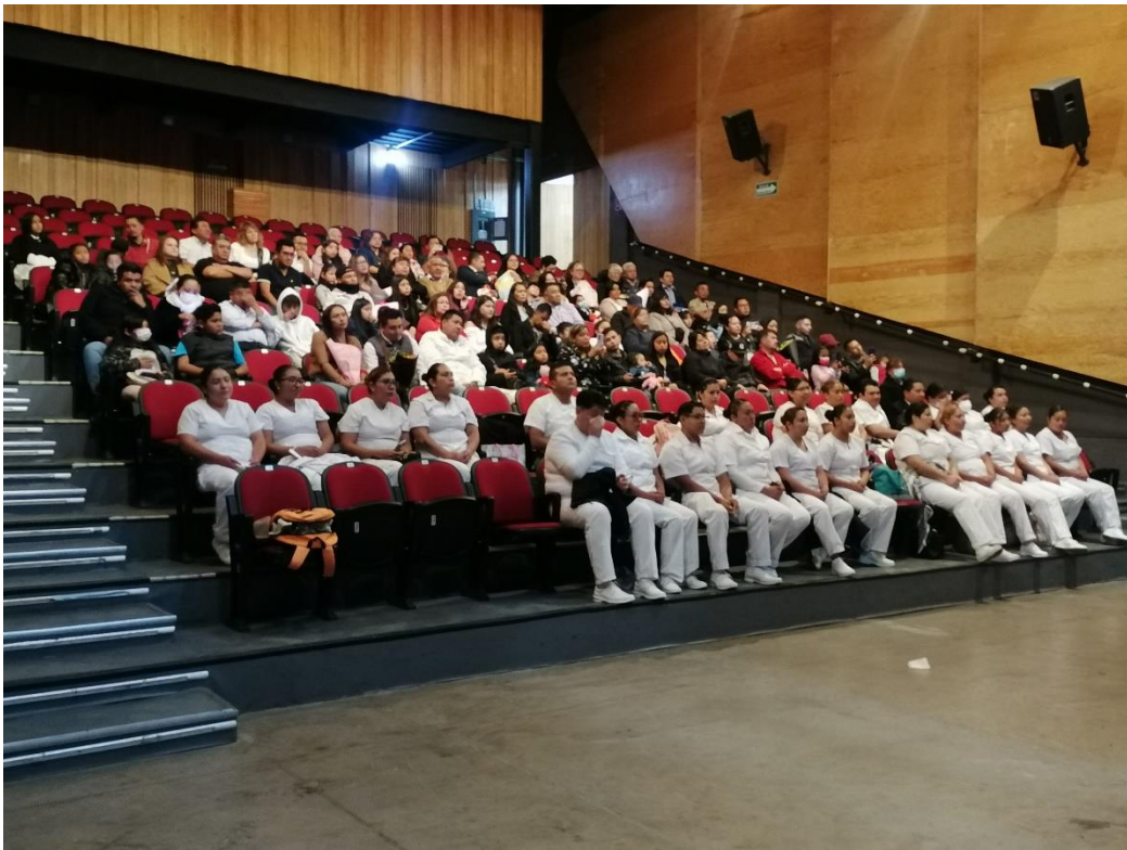
3 DE FEBRERO. GRADUACIÓN DE ESCUELA DE ENFERMERÍA