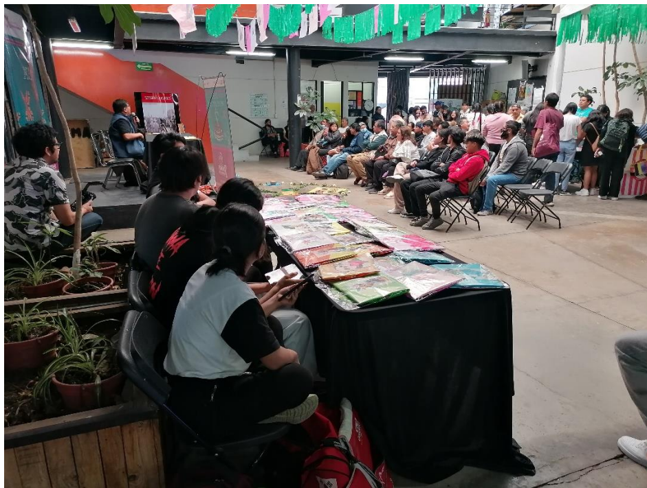
23 DE FEBRERO. CELEBRACIÓN DEL SÉPTIMO ANIVERSARIO DE FARO MIACATLÁN