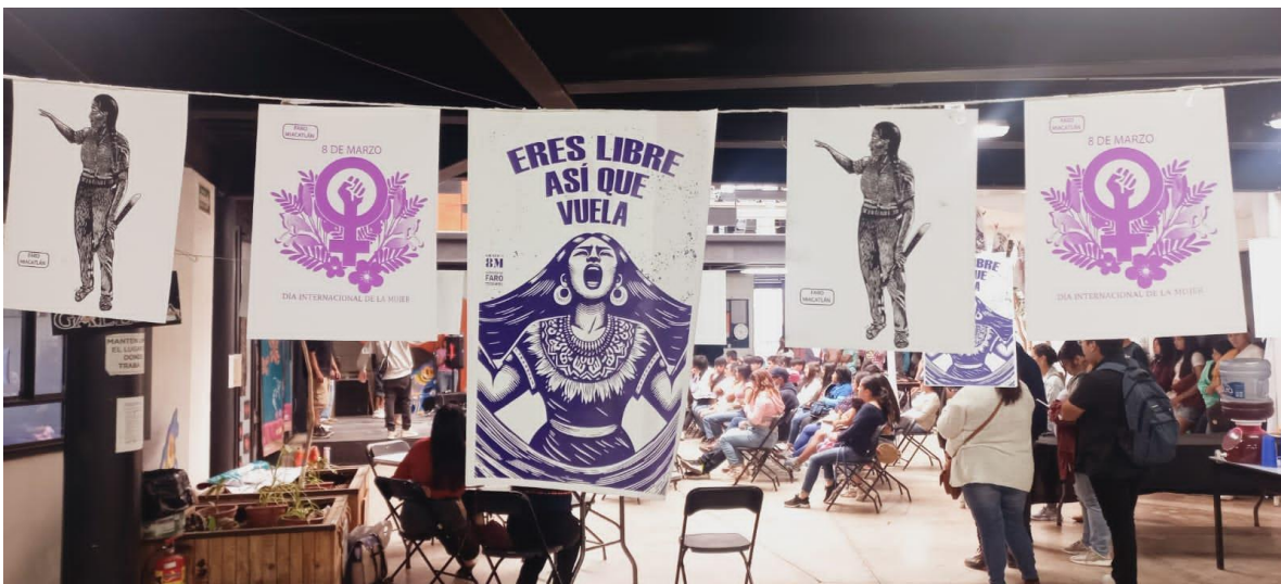
8 DE MARZO. DÍA INTERNACIONAL DE LA MUJER.