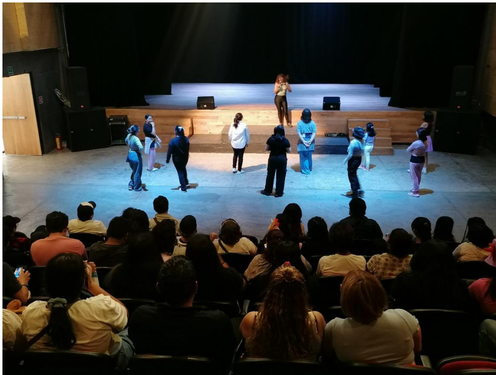
23 DE MARZO. MASTER CLASS DE K- POP