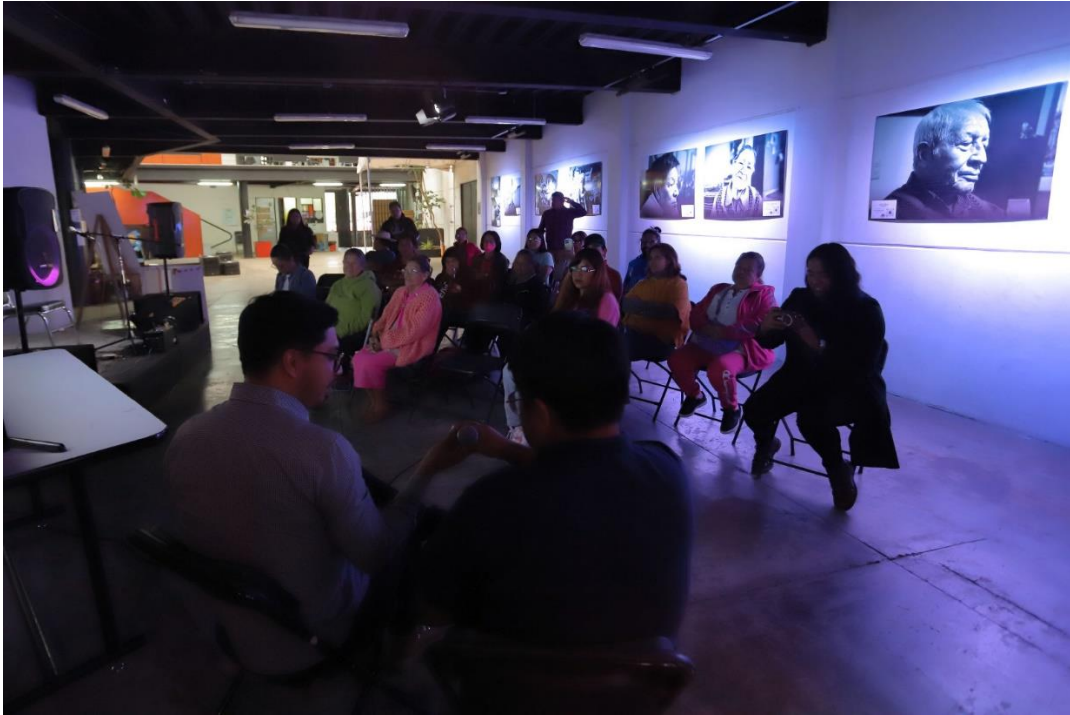
14 DE FEBRERO. EXPOSICION "RELATOS VIVOS"