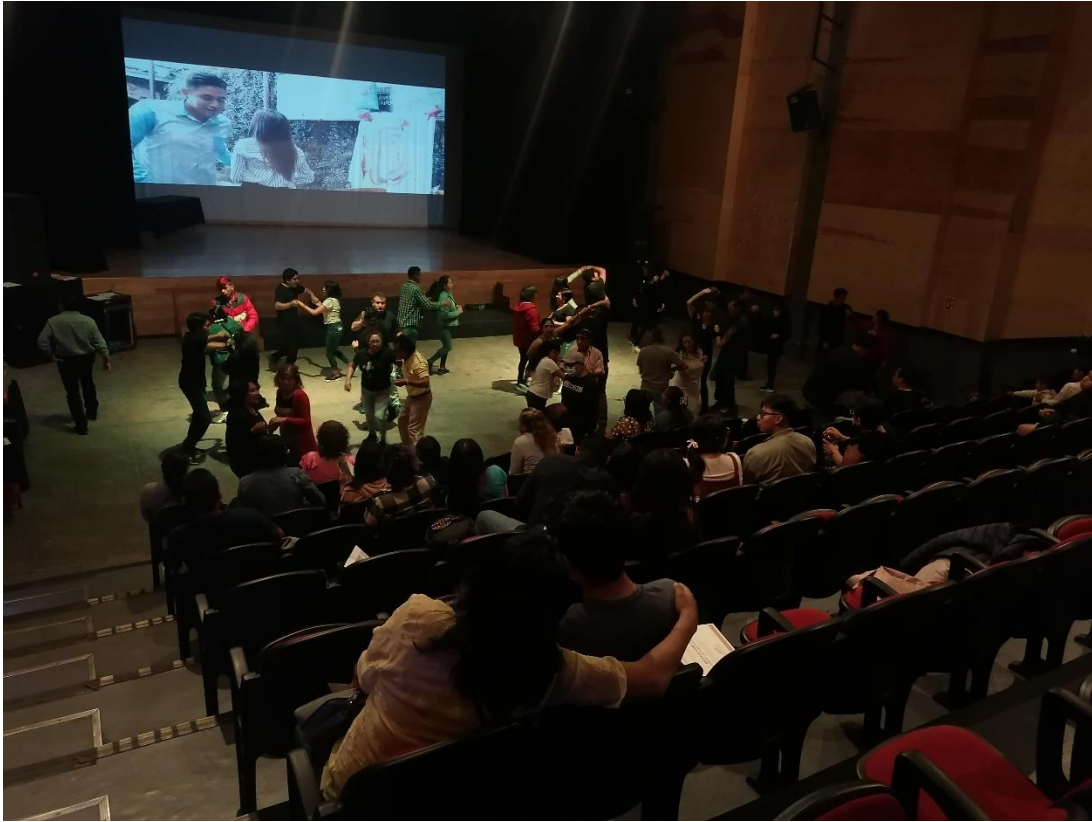
22 DE MARZO. VIERNES SOCIAL DE BAILE