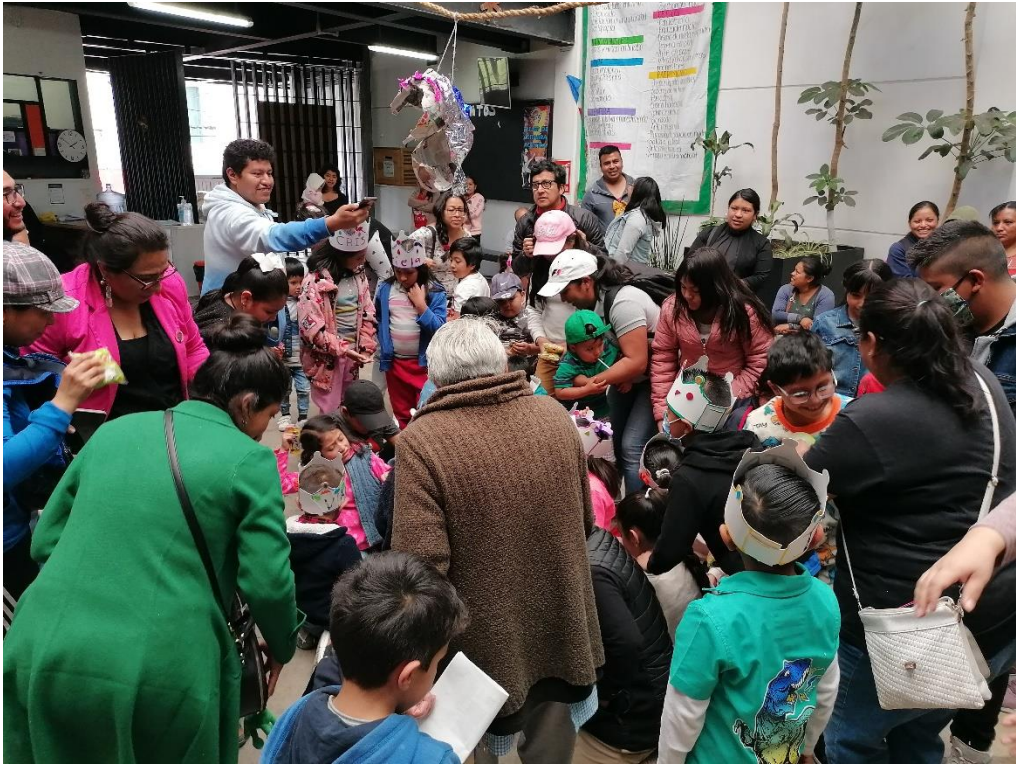
13 DE ENERO. DÍA DE REYES.