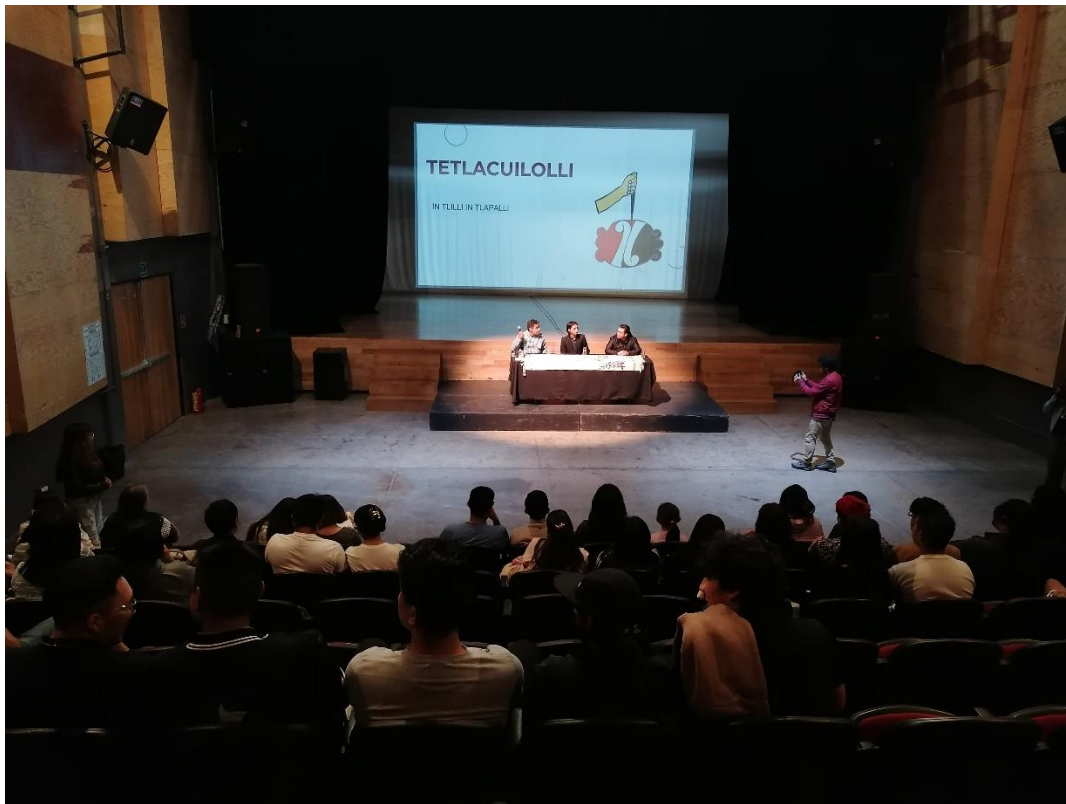
9 DE FEBRERO PRESENTACIÓN DE LA APLICACIÓN "TETLACUILOLLI"