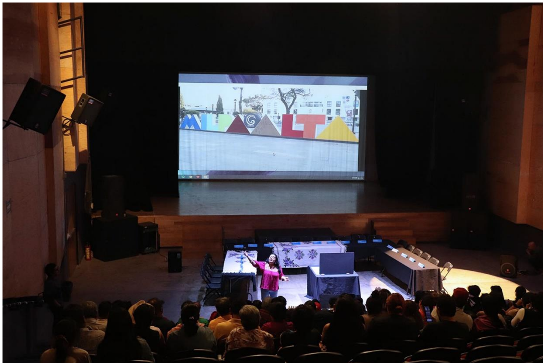
22 DE MARZO. DÍA INTERNACIONAL DEL AGUA.