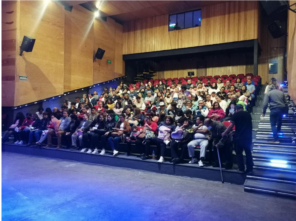
24 DE FEBRERO. ANIVERSARIO DE LA ACADEMIA DE DANZA "TEPEYOLOTLI"