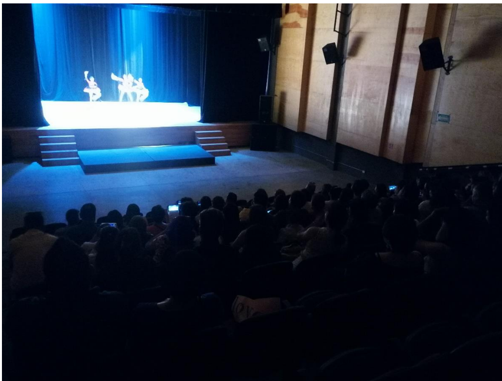
9 DE MARZO. PRESENTACIÓN DE ACADEMIA DE DANZA “STUDIO 18”