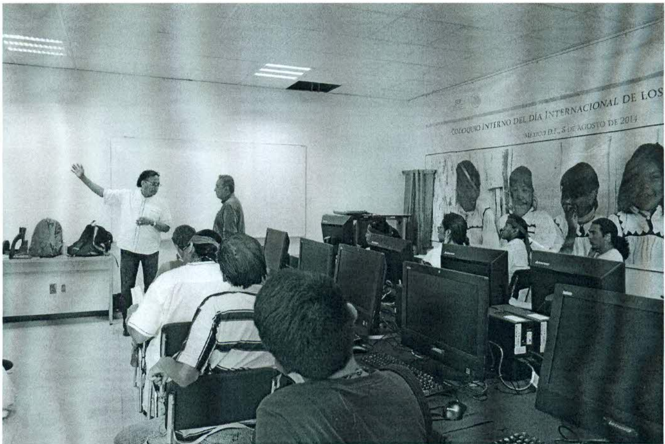
Inicio de la sesión de asesoría.

En total participaron 17 promoventes del bien cultural (adjunto directorio).