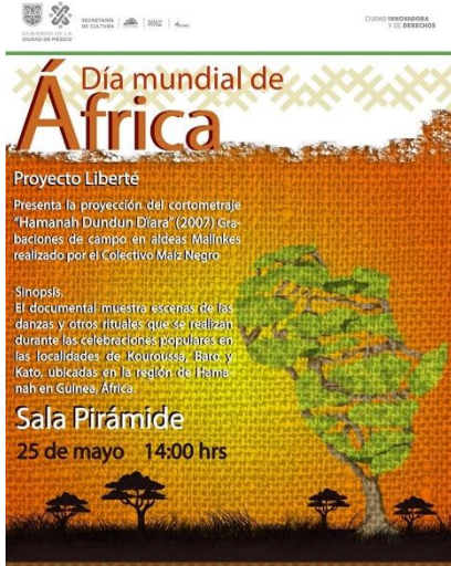
Día Mundial de África 25 mayo