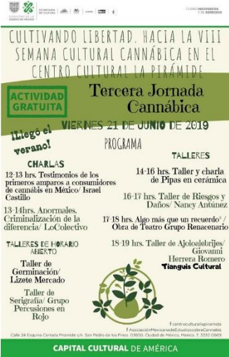
Tercera Jornada Cannábica “Cultivando libertad” 21 junio