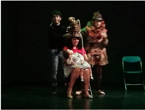
“Pequeño Gran Festival” 27 abril