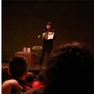
World Goth Day 18 mayo