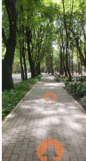
Señalamientos para guiar hacia la Feria.*

Para mejorar la experiencia de los asistentes al evento, se propone complementar el evento con activaciones que estén relacionadas al espacio donde se realiza la feria, el Bosque de Chapultepec, y a proporcionar espacios de convivencia durante la feria.