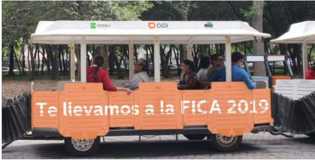
Fomentar la visita alrededor del Parque.*